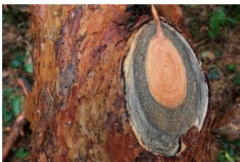
Fot. 4. Sinizna drewna