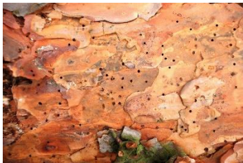
Fot. 1. Ślady zasiedlenia na korze