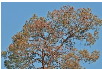
Fot. 3. Usychające igły w koronie sosny