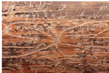
Fot. 2. Żerowisko z komorą godową