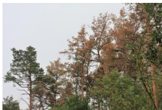
Fot. 5. Zasiedlane sosny zamierają